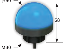
K50L [単位: mm]